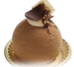
ロンロン・キャフェ コーヒームースの中に、しっとり焼きシヨクラ、周りはミルクチョコでコーティング。 ●500円(税込価格540円)