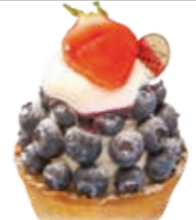
ブルーベリータルト ブルーベリーづくしのケーキです。 ●500円(税込価格540円)