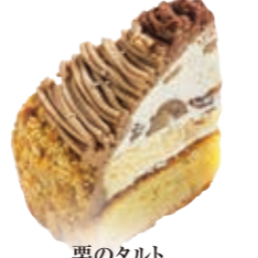
栗のタルト 和栗をタルトで仕上げました。 ●480円(税込価格518円)