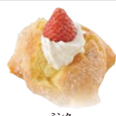
ミンク 人気のカスタードクリームをふんわりスポンジで包み込みました。 ●300円(税込価格324円)