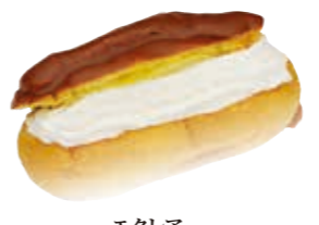
エクレア 生クリームとチョコカスタードがとてモグッド。 ●230円(税込価格248円)