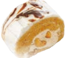
キャラメルロール サクサクとしたカシューナッツとクルミが美味しいキャラメル味。 ●420円(税込価格453円)