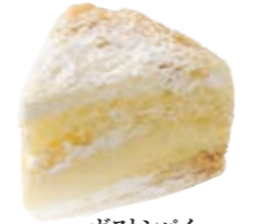
ポストンパイ ボリュームたっぷり。カスタードクリームとパイの味がマッチしたケーキ。 ●400円(税込価格432円)