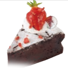
ガトーショコラ スイートチョコレート・バター・生クリームを練り込み、じっくり焼き上げたチョコレートケーキ。 ●440円(税込価格475円)