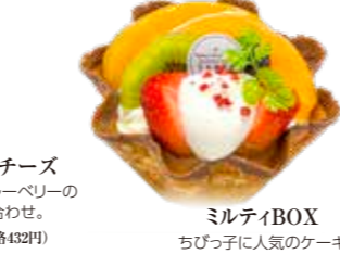
ミルティBOX ちびっ子に人気のケーキです。 ●440円(税込価格475円)