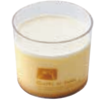
生プリン 口当たりのなめらかなプリンです。 ●180円(税込価格194円)