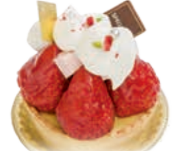
キャトルフレーズ エッグタルトにいちごと生クリームがよく合います。 ●500円(税込価格540円)