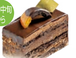
ジュピター チョコレートづくしのちょっと濃いめのケーキです。 ●500円(税込価格540円)