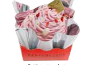
いちごのモンブラン いちごの生クリームに白あんが良く合います。中心には、丸ごといちごが入っています。 ●420円(税込価格453円)