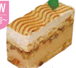
デセール・マロン マロンのバリバリにマロンのクリームに甘露煮、栗づくしのケーキです。 ●460円(税込価格496円)