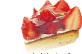
タルト・オブ・フレーズ ビスケットの上にたっぷりの苺をあしらいました。 ●500円(税込価格540円)