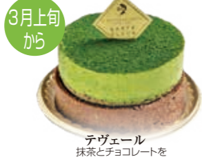
テヴェール 抹茶とチョコレートを組み合いました。 ●460円(税込価格496円)