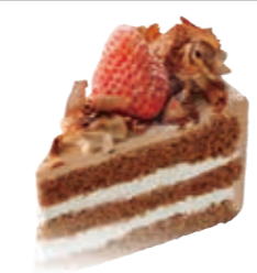
ブラウン 生チョコケーキ。 ●400円(税込価格432円)