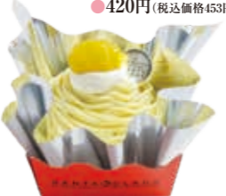
モンブラン バター風味の生地に栗のクリームを合わせました。 ●420円(税込価格453円)