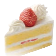
いちごのショートケーキ 卵たっぷり、無添加スポンジのいちごのショートケーキ。 ●400円(税込価格432円)