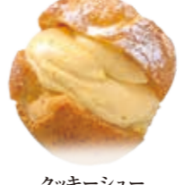
クッキーシュー 濃厚カスタードクリームとサクサクのシュー生地がベストマッチです。 ●210円(税込価格226円)