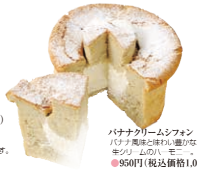
バナナクリームシフォン バナナ風味と味わい豊かな生クリームのハーモニー。 ●950円(税込価格1,026円)