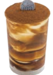
マリア スタイリッシュなティラミスです。 ●440円(税込価格475円)