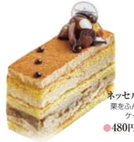
ネッセルロード 栗をふんだんに使ったケーキです。 ●480円(税込価格518円)