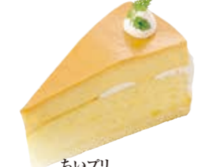
ちいプリ チーズケーキの上にプリングのつた新しいケーキ。 ●400円(税込価格432円)