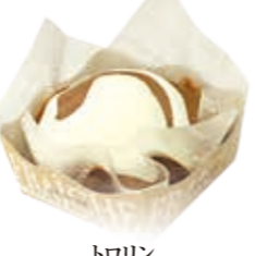
トロリン チーズムースをクレープで包み、チョコレートソースをかけました。 ●420円(税込価格453円)