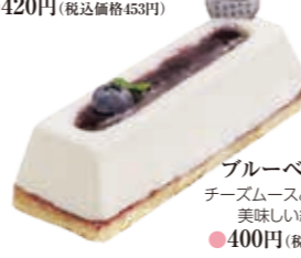
ブルーベリーチーズ チーズムースとブルーベリーの美味しい組み合わせ。 ●400円(税込価格432円)