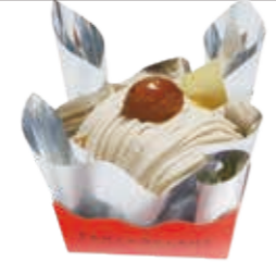
洗栗のモンブラン 数種類のマロンペーストと生クリームで練り上げた、マロンクリームで仕上げています。 ●420円(税込価格453円)