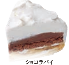
ショコラパイ パイの上にバナナをしきつめ、チョコのカスタードと生クリームで仕上げました。 ●400円(税込価格432円)