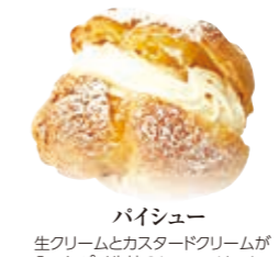
パイシュー 生クリームとカスタードクリームが入ったパイ生地のシュークリーム。 ●250円(税込価格270円)