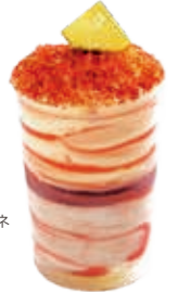
ティアラ いちごとマスカルポーネチーズの組み合わせが良く合います。 ●440円(税込価格475円)