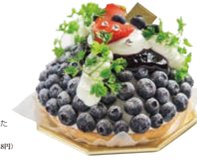
要予約 ブルーベリーのアントルメ(4号) フレッシュなブルーベリーをふんだんにしきつめブルーベリーソースで仕上げています。 ●2,500円(税込価格2,700円)