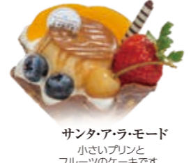
サンタ・ア・ラ・モード 小さいプリンとフルーツのケーキです。 ●480円(税込価格518円)