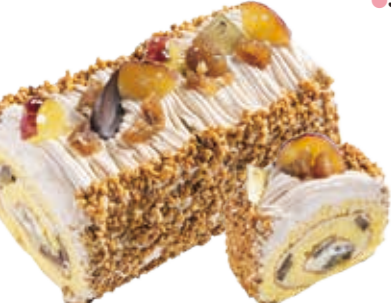
秋のロールケーキ クリやイモ。秋の食材をもちもちのロールケーキで巻きました。 15cm ●1,800円(税込価格1,944円) ショート ●420円(税込価格453円)