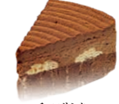
チョコサンタ チョコスポンジの上にとっぷりとチョコムースをのせた甘〜いケーキ。 ●420円(税込価格453円)